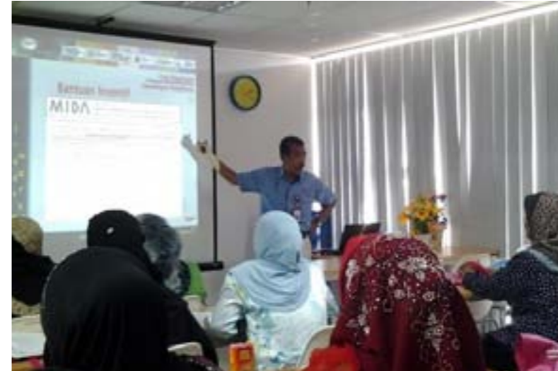
Klinik Harta Intelek Siri II/2014 @ UTC Melaka 12hb Mac 2014

* Semua jenis program/kursus ICT yang dianjurkan oleh Bahagian K-Ekonomi adalah PERCUMA