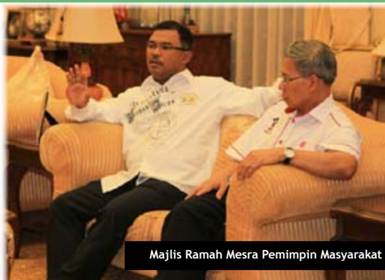
Majlis Ramah Mesra Pemimpin Masyarakat