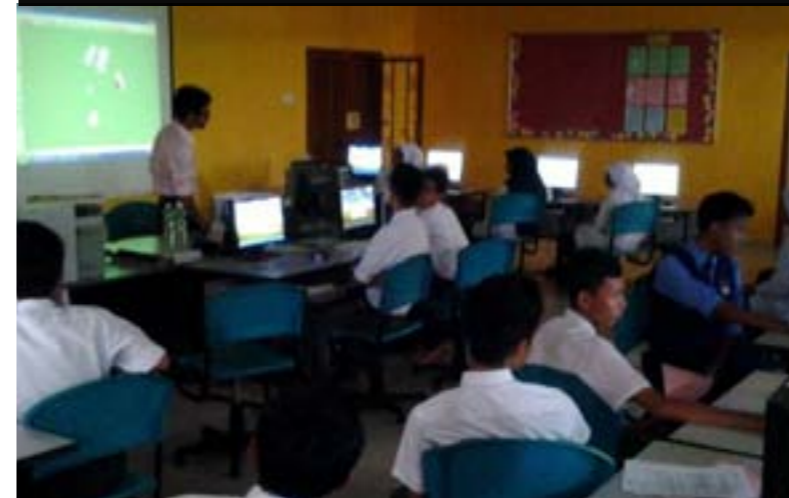
Kursus Media Bersiri di SMK Tun Tijah 20hb Mac 2014