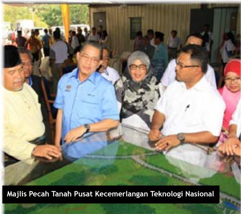
Majlis Pecah Tanah Pusat Kecemerlangan Teknologi Nasional