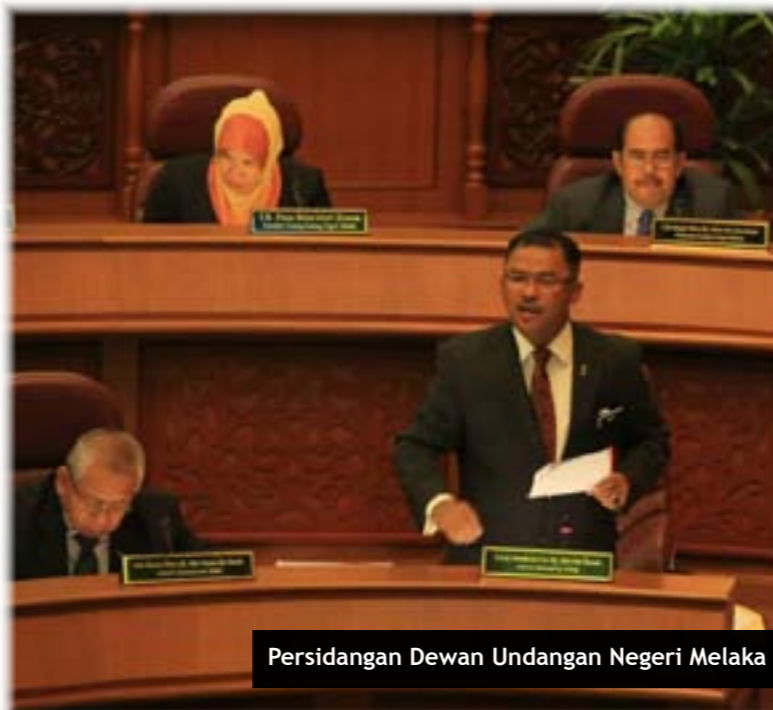
Persidangan Dewan Undangan Negeri Melaka