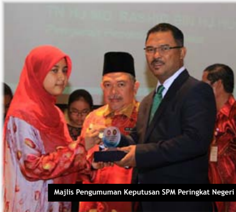
Majlis Pengumuman Keputusan SPM Peringkat Negeri