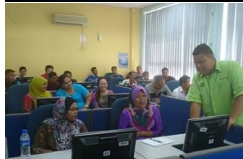
Latihan Asas Komputer dan Internet @ K-Ekonomi 25hb Mac 2014