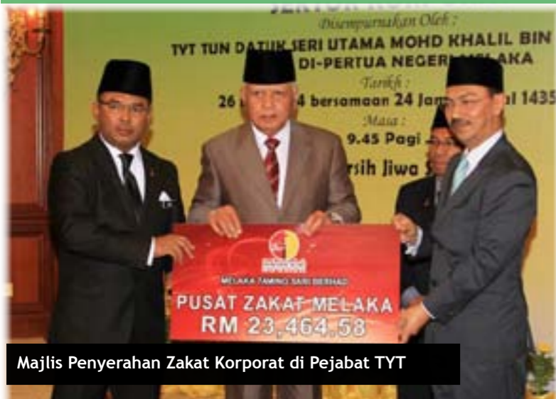
Majlis Penyerahan Zakat Korporat di Pejabat TYT