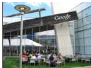
Ibu Pejabat Google, Googleplex

Syarikat yang kini dipimpin oleh Larry Page selaku Ketua Pegawai Eksekutif merupakan antara jenama yang paling terkenal dan berpengaruh di dunia menurut Forbes.com . Ibu pejabat korporat bagi Google terletak di California, Amerika Syarikat yang juga dikenali sebagai Googleplex manakala jumlah pekerja yang dimiliki oleh syarikat Google sehingga suku tahun keempat 2013 di seluruh dunia melebihi 47,000 orang.