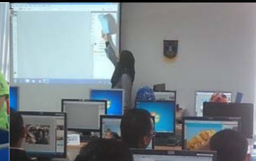
Bengkel Rekabentuk Grafik: Adobe Photoshop 26hb Mac 2014