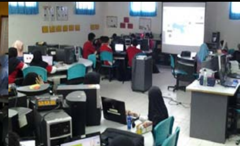
Kursus Media Bersiri di SMK Dato' Hj. Talib Karim 25hb Mac 2014