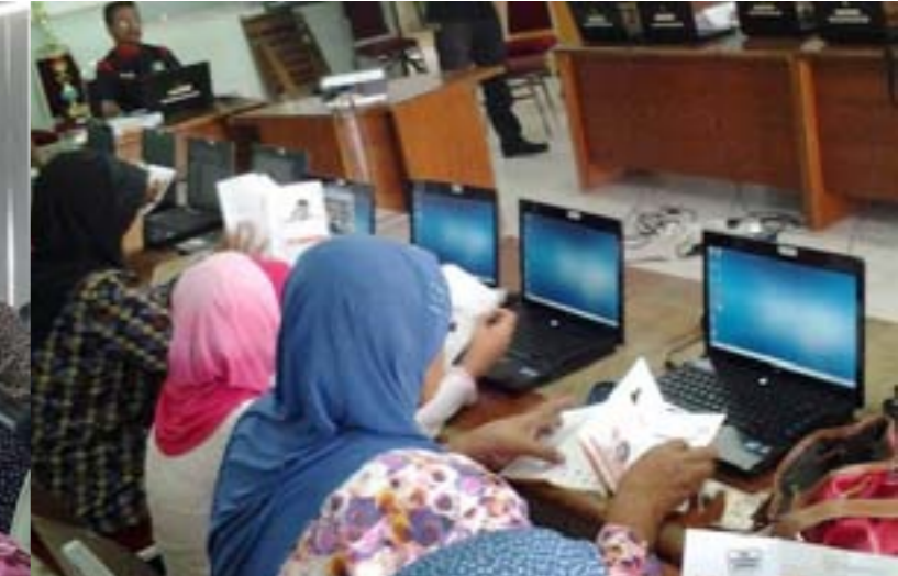
Program eMelaka @ Kampung Air Tawar, Merlimau 22hb - 23hb Mac 2014