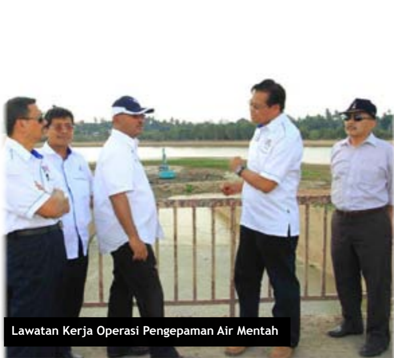
Lawatan Kerja Operasi Pengepaman Air Mentah

Hak Cipta Terpelihara | Mana-mana bahagian penerbitan ini tidak boleh dikeluarkan ulang, disimpan dalam sistem dapat kembali, atau disiarkan, dalam apa-apa jua cara, sebelum mendapat izin bertulis daripada Bahagian K-Ekonomi. Sidang editor berhak melakukan penyuntingan ke atas tulisan yang diterima selagi tidak mengubah isinya. Bahagian K-Ekonomi mahupun Kerajaan Negeri Melaka tidak akan bertanggungjawab sekiranya maklumat di dalam Buletin ini menyebabkan kerugian kepada para pembaca kerana maklumat yang disampaikan tidak semestinya mencerminkan pendapat dan pendirian Bahagian K-Ekonomi mahupun Kerajaan Negeri Melaka.